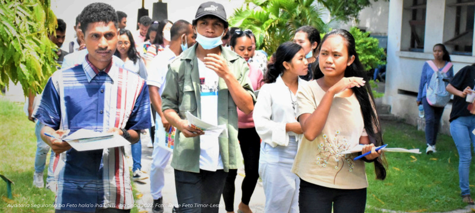
Auditoria Seguransa ba Feto hala'o iha UNTL iha tinan 2022.