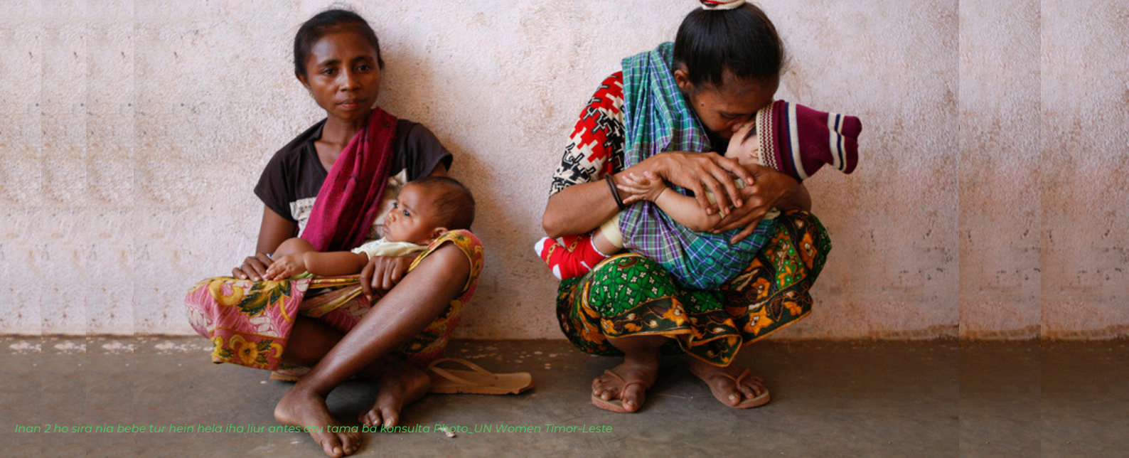
Inan 2 ha sira nia bebe tur hein hela iha liur antes atu tama ba konsulta