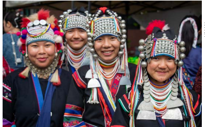
WE Centre พิธีเปิด, อำเภอเมือง จังหวัดเชียงราย

ศูนย์ WE ทำหน้าที่เป็นพื้นที่ปลอดภัยในชุมชนที่ผู้หญิง รวมถึงภาคีหรือองค์กรผู้ชายสามารถร่วมแลกเปลี่ยนเพื่อส่งเสริมความเสมอภาคระหว่างเพศ ส่งเสริมความเป็นผู้นำของสตรี เสริมสร้างบทบาทในการสร้างสันติภาพของสตรี และขยายโอกาสทางเศรษฐกิจของสตรี